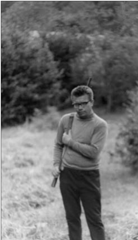
В горах Кавказа. 1972 г.