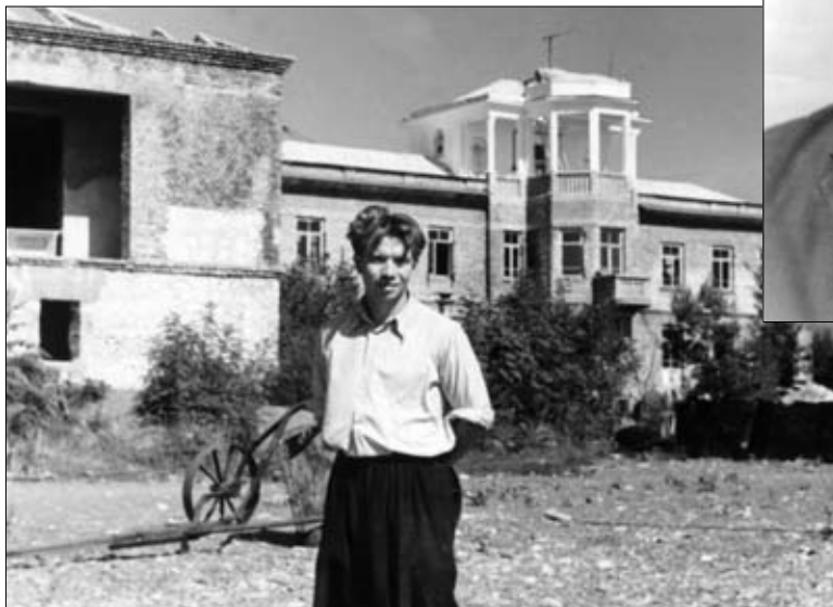
Годы молодые... Сухуми, 1960 г.