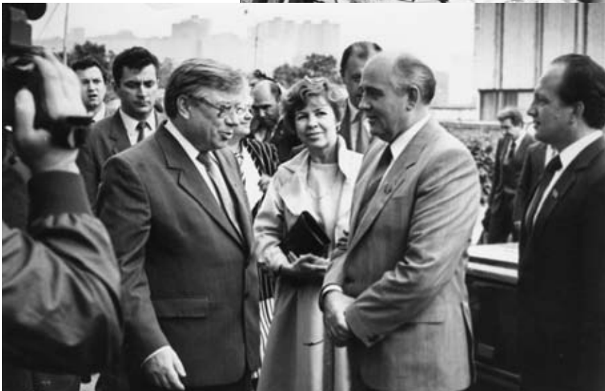
Встреча с первым Президентом СССР М.С.Горбачевым. Владивосток, 1987 г.