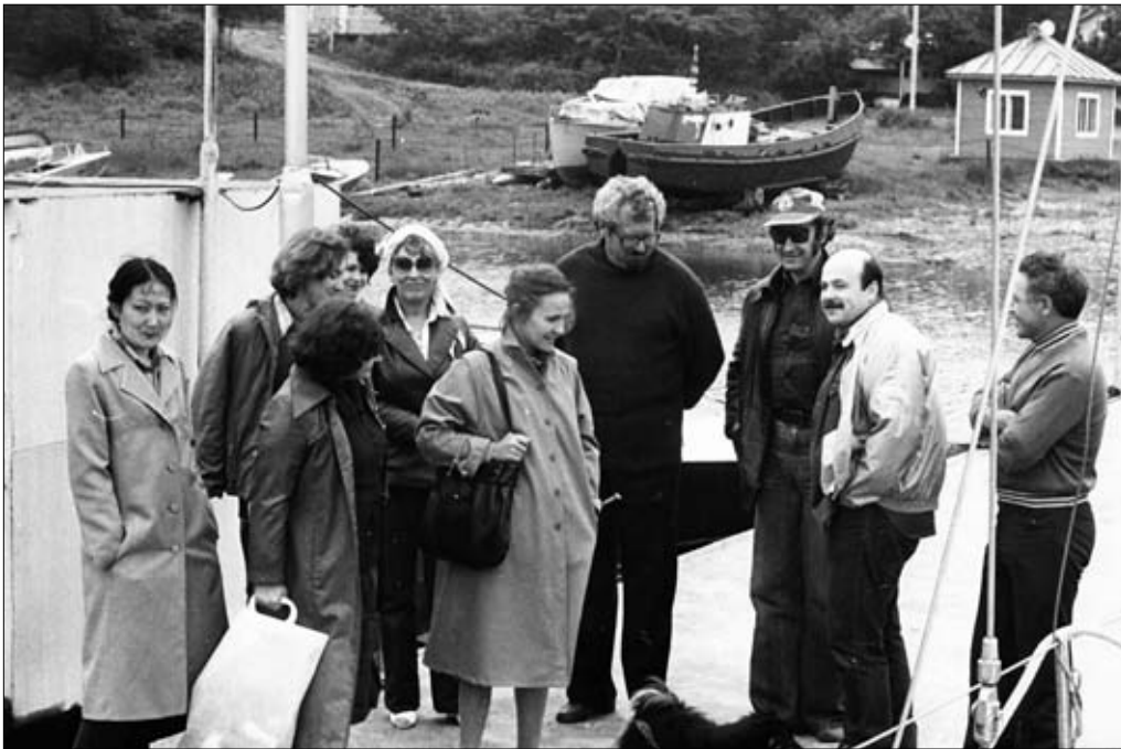
Актеры МХАТ им. А.М.Горького были частыми гостями семьи Ильичевых. О-в Попова, 1979 г.

В это время он начал создание своей многочисленной научной школы. Защищены диссертации – в 1965 г. кандидатская, в 1972-м – докторская. Сухумская научная морская станция к этому времени стала филиалом Акустического института, превратившись в мощный центр гидроакустических исследований. Постановлением Правительства СФАН АН СССР был определен головной в стране научной организацией по проблеме гидроакустической классификации.