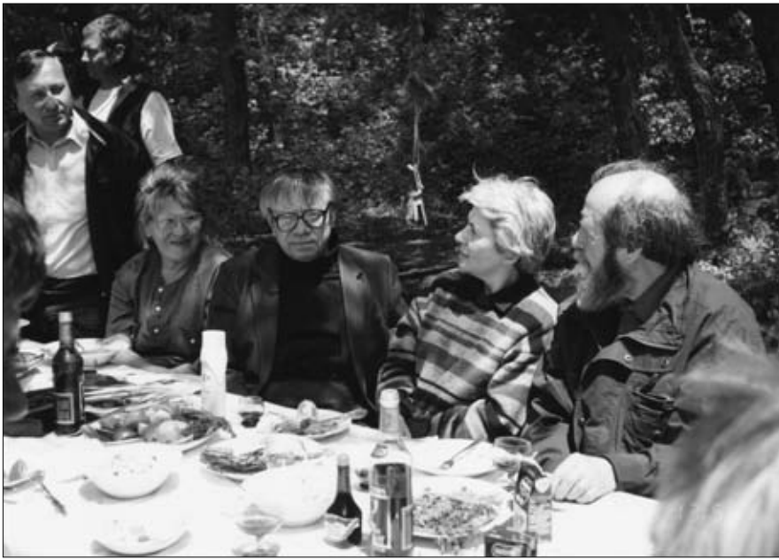
А.И.Солженицын с супругой в гостях у В.И. и М.В. Ильичевых. О-в Попова, 1993 г.