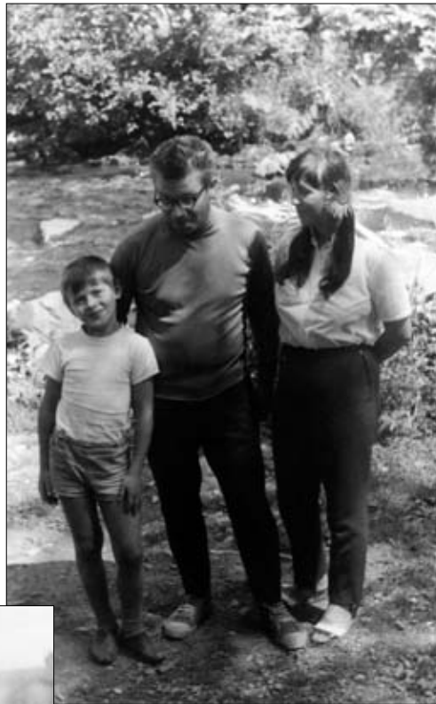
С женой и сыном. Сухуми, 1970 г.