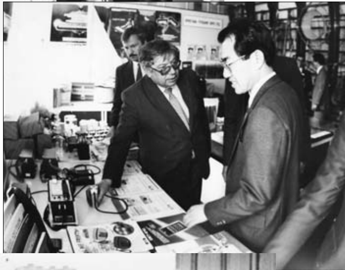
Сотрудничаем с японцами. Выставка приборов. Владивосток, 1986 г.