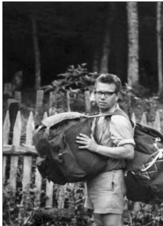
В поход! 1973 г.